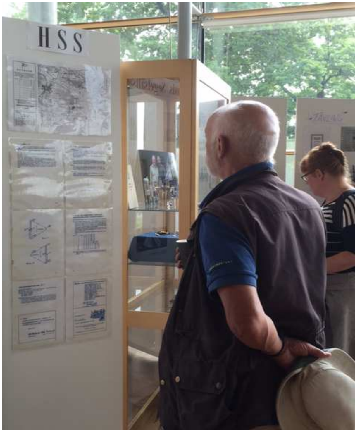
Invigning utställningen om Segelsällskapet i Härnösand HSS

liga har varit fullsatta. Vi kommer att fortsätta programserien under våren. Vi arbetar även för att göra oss mer tillgängliga för grund- och gymnasieskolor. Vår ambition är att vi ska ha en arkivpedagog på plats till januari 2017. En annan stor utmaning vi står inför är den allt mer digitala dokumenthantering vid alla föreningar. Vi måste rusta oss för det. För att skapa oss en bild av i vilken omfattning och för vilken typ