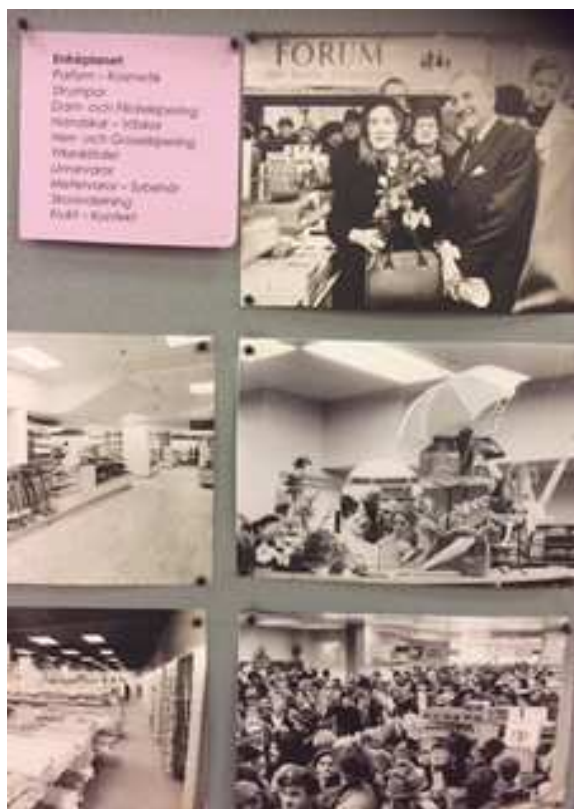
Utställningen Forum - Allt för hemmet

På Medelpadsarkiv i Sundsvall valde vi att göra en utställning om Varuhuset Forum. En anledning till det var att vi under 2015 fick en stor leverans från Konsum centralt som innehöll arkiv från konsumföreningar från Västernorrland. Vi valde att döpa utställningen till Varuhuset Forum – Allt för hemmet eftersom kunden verkligen kunde köpa allt till sitt hem där. Utställningen innehåller bland annat en mängd fotografier både på Forumhuset, personalen, kunder och inte minst interiörsbilder från de olika avdelningarna. Utställningen kommer att finnas kvar till sommaren. Under dagen hade vi en jämn ström av besökare och många uppskattade vår utställning. Om du har tid och lust är du välkommen in att skriva dina minnen från Forum i vår minnesbok.