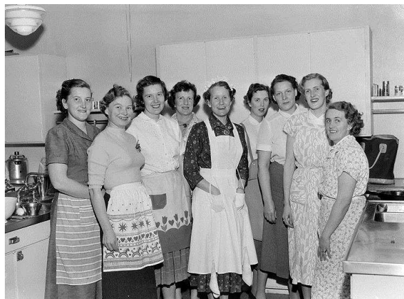
Örnsköldsviks husmodersförening genomför fiskkurs på Folkskolan 1954.

munarkivet, Läns museet Murberget och Landstinget. Till Arkivens dag i Härnösand kom 123 besökare.