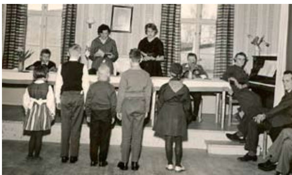
Föreningens 60-årsfirande i lokalen Frideborg, 1961.

Ungdomslogen 262 Norden bildades år 1901 i Härnösand. Den första protokolls-boken som finns bevarad är mellan åren 1903-1907. Protokolls-boken har legat under golvet i Västernorrlands gamla kanslihus. Det var i mars år 1960 i samband med att huset skulle rivras som boken upptäcktes. Den låg inne i en vaxtygsväska under golvet på övervåningen. Protokolls-boken överlämnades till dåvarande lantsantikvarie Bo Hellman som av en tillfällighet råkade var i huset för att ta tapetprover och överlämnade den i sin tur till dåvarande landsarkivarie Hasse Petrini. Protokolls-boken överfördes senare till Föreningsarkivet Västernorrland.