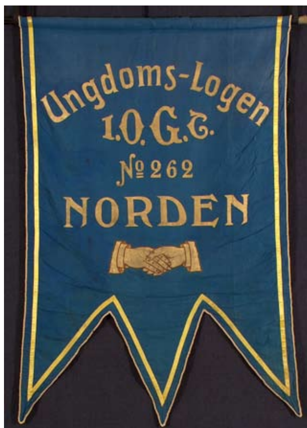
Ungdomslogen nr 262 Nordens standar