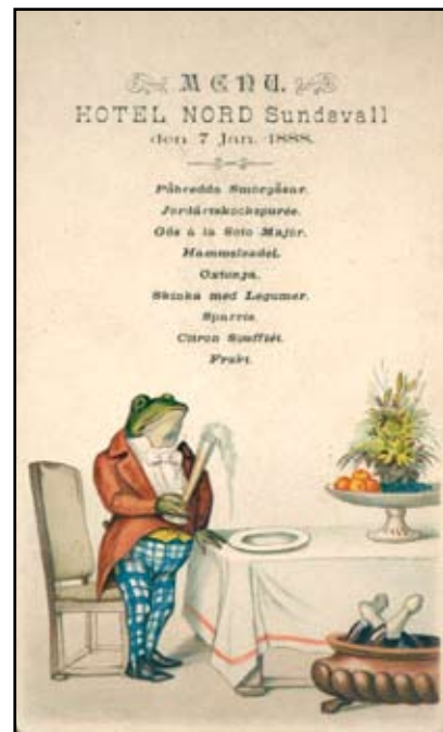
Menyn är hämtad från Sundsvalls kommunarkivs småtrycks-samling.

Kampanjen Efterkrigstidens miljöer och minnen har haft en avslutande mäsas i Kulturmagasinet lokaler i Sundsvall. Under temat Moderna möten visades resultatet av ett flertal projekt i länet. Utställningarna kryddades med ett antal föredrag och en dokumentärfilm om Sidsjöns gamla sjukhus. Ca 1.500 besökare passerade intresserat. Kampanjen har pågått under tre år med stöd av Länsstyrelsen Västernorrland. Medelpadsarkiv har inte deltagit i kampanjen men passade på att visa material från det pågående projektet Minnen från mat och dryck under rubriken "Kaffe Kakor Pilsner".