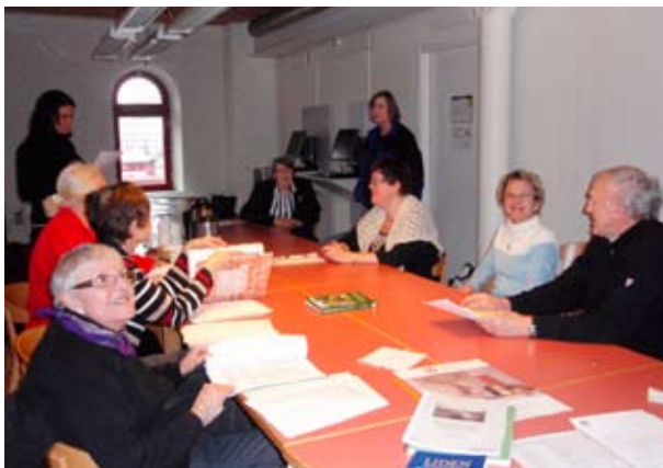
Här ses kursdeltagarna nyfiket bläddra bland olika historiker.

Föreningsarkivet Västernorrland ordnade en kurs i arkivkunskap. Den gick av stapeln den 15 mars och platsen var Nordstiernan i Kulturmagasinet i Sundsvall.