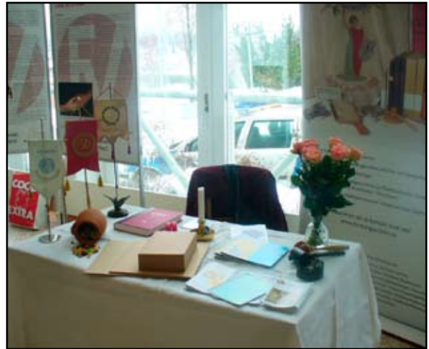
På internationella kvinnodagen den 8 mars fanns Föreningsarkivet Västernorrland på plats i Tonhallens foajé med utställning, roll up och försäljning av arkivkartonger.

Sedan 15 år tillbaka har man firat den internationella kvinnodagen i Sundsvall. Föreningsarkivet Västernorrland har varit representerad sedan 2006. Med material hämtat ur våra arkiv har vi färdigställt utställningar om Centerkvinnor i distriktet, socialdemokratiska kvinnoföreningar i Sundsvall, och kampen för kvinnlig politisk rösträtt. I år blev det en utställning om kvinnodagen i Sundsvall och föreningen Qvinnouniversitetet. Föreningen har lämnat in sitt arkiv till FV och tillsammans har vi försökt ge en bild över föreningens verksamhet och arbete med kvinnodagen. Det utmynnade i en utställning och en broschyr över föreningens arbete. Utställningen kommer att visas på Sundsvalls stadsbibliotek i mars nästa år.