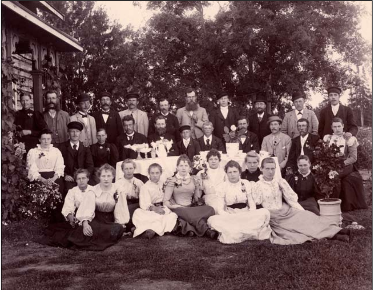
De på fotot som har det trevligt i sommartid är medlemmar ur logen Enighet som fanns på Hovid Alnö, Bilden är tagen kring sekelskiftet.

Personal och styrelse vid Föreningsarkivet Västernorrland önskar alla läsare en trevlig sommar med många kaffekalas.