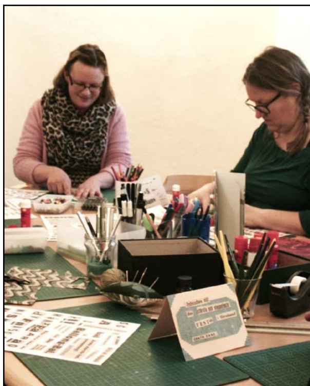
Ovan: Besökare vid pysselbordet i Härnösand Nedan: Deltagare i danslektionen