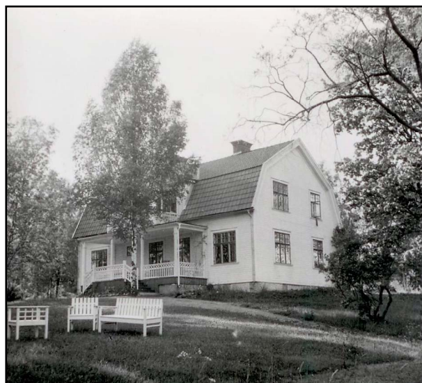
Ovan: Semesterhemmet Solebo.

Verksamheten rullade på i 25 år, och tusentals husmödrar semestrade på Solebo. Men som med allt annat går det även trender i hur man ska spendera sin semester. Familjesemestrar var i ropet och Solebo fyllde inte längre samma funktion som när det startade. Sommaren 1969 blev den sista då man 1970 lämnade återbud till de inbokade gästerna och sedan sålde fastigheten till Landstinget.