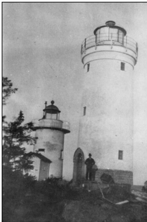
Lungö fyr.